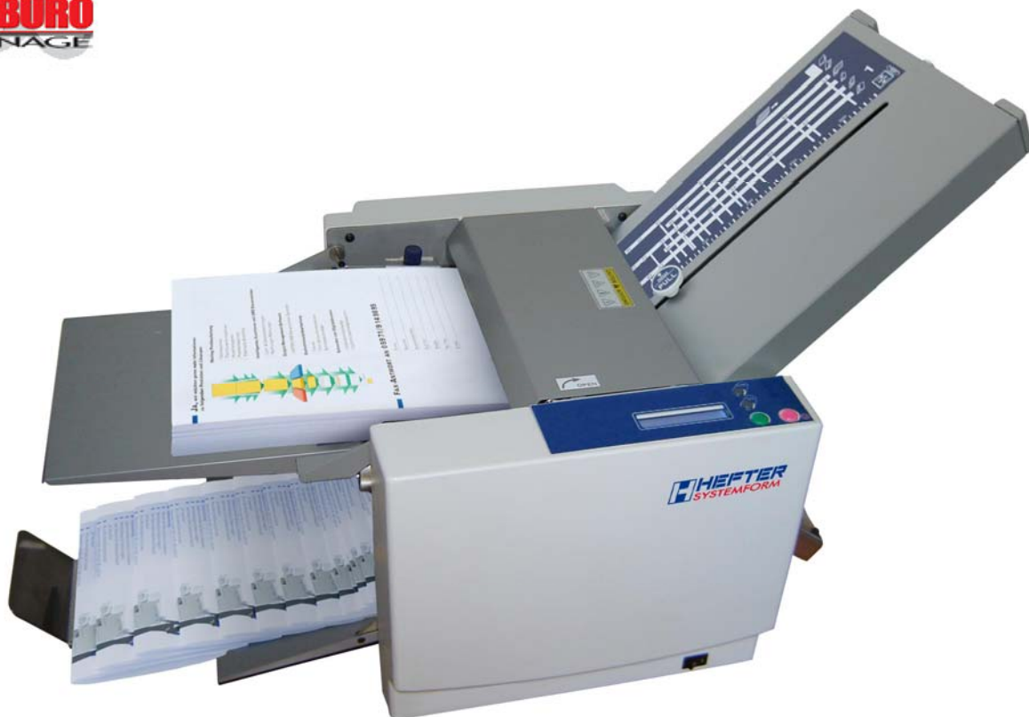
La plieuse de bureau compacte et économique