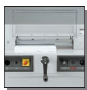
Carter de protection avant