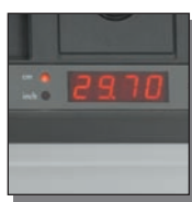
Affichage digital des dimensions

Ce massicot électrique dispose d'une tenue professionnelle et de nombreux équipements à vous couper le souffle.